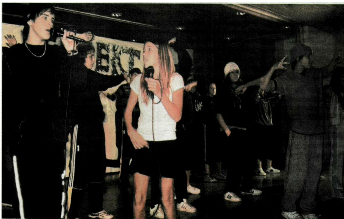
Die Fricker Jugendlichen bei einem ihrer Auftritte im Vorfeld des Wettbewerb-Finals.