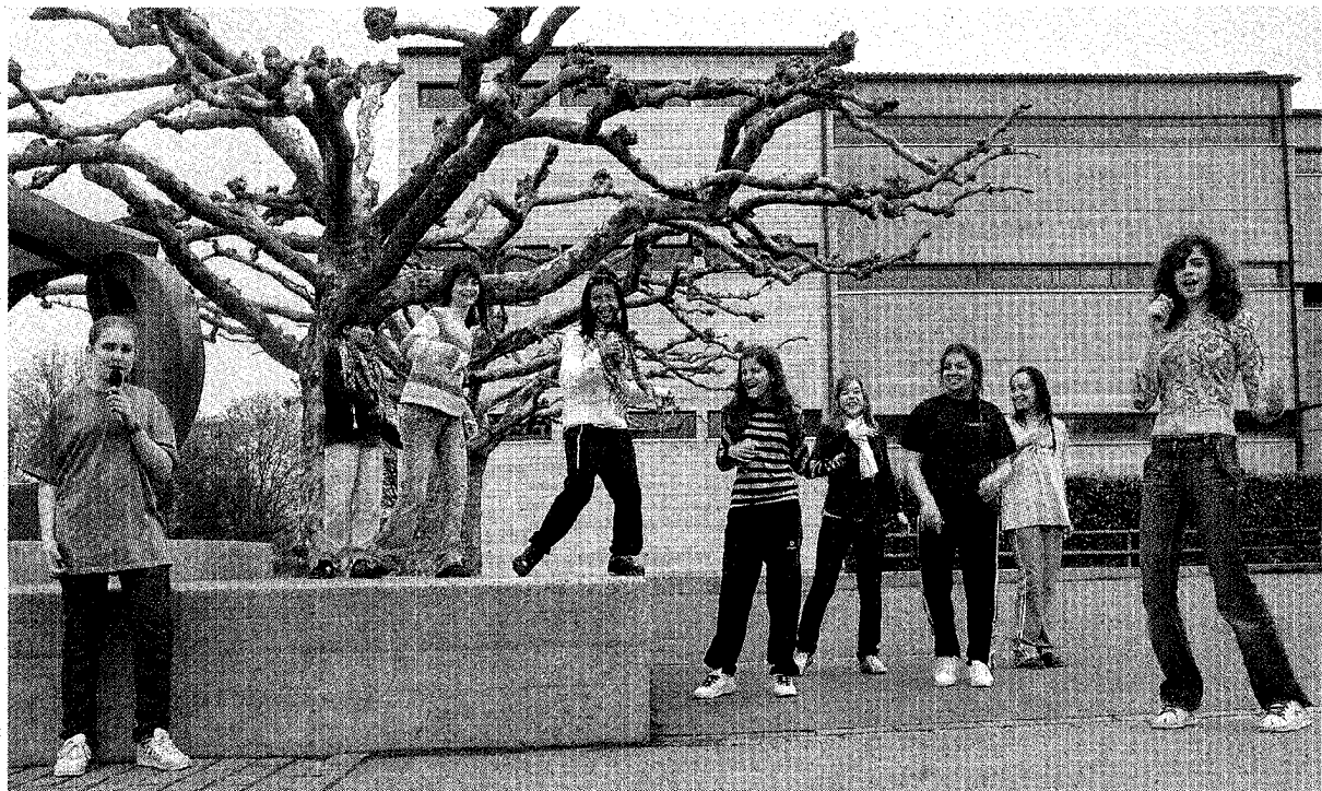
Wollen mit Ihren Songs am Sonntag in Zürich mitmischen: Die Sechstklässlerinnen aus Kreuzlingen.

Sonntag, 13. April, im Volkshaus Zürich, Stauffacherstrasse 60, 16 bis 18 Uhr